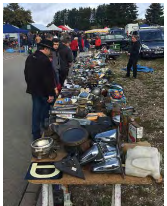
Schrott? Von wegen! Für Oldtimer-Fans liegt hier so manches Schmuckstück.

Mittlerweile ist hier alles zu haben, was mit kulturhistorischen Fahrzeugen zu tun hat: Ersatzteile und Raritäten, restaurierte und unrestaurierte Automobile und Zweiräder, Unmengen an Kleinteilen, ebenso Fachliteratur und Teile, die zunächst als Schrott anmuten, sich aber durchaus als lange gesuchte Ersatzteile herausstellen können.