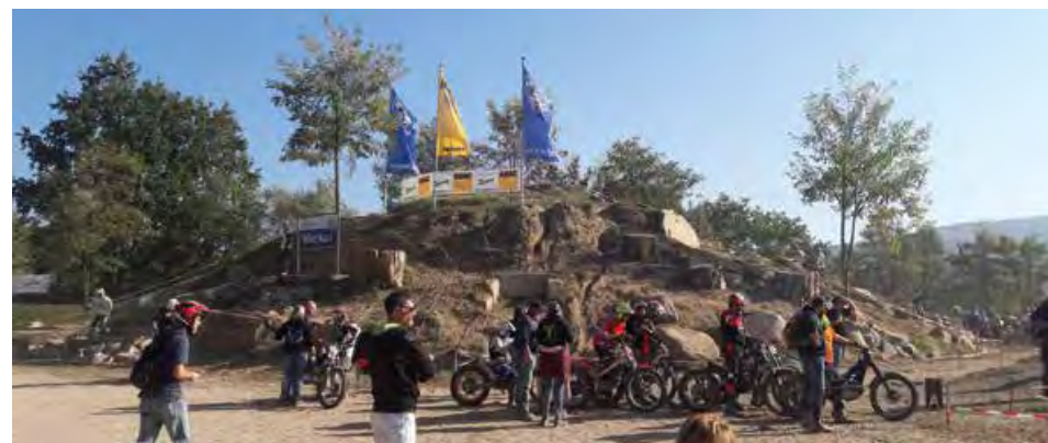
Gelungene Veranstaltung bei Top-Wetter: Am 20./21. Oktober führte der MC Baden-Baden auf seinem Trialgelände in Baden-Baden Oos die Finalläufe zur TSG-/TSV-Meisterschaft sowie zur Baden-Württembergischen ADAC/DMV Jugendtrial Meisterschaft, als auch Läufe zur SAM-/IBRMV-Wertung durch. Bei bestem Wetter nahmen an zwei Tagen insgesamt 198 Fahrer teil. Bild: FMC