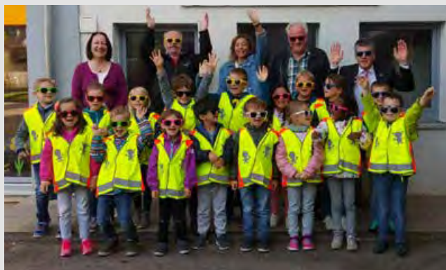
Winden im Elztal: Siebzehn Abc-Schützen der Hörnlebergschule starteten – zusammen mit Rektorin, Lehrerin, Bürgermeister und Vorsitzenden – nach Überreichung der neuen Sicherheitswesten und der coolen Sonnenbrillen eine La Ola...